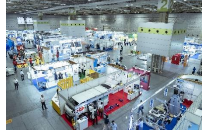
展示場の様子（下水道展'21 大阪）

日本の重要なインフラである下水道は、今後、高度経済成長期以降に整備した大量の下水道管の多くが標準耐用年数（50年）を迎えるため、老朽化対策とあわせて雨水排除能力の増強や耐震性の向上などを図る再構築や補修を計画的に進めていかなければいけません。また、7月～10月頃にかけて多くなる 台風や大雨等による浸水、地震といった自然災害に対応する製品やサービス・技術も展示予定 です。