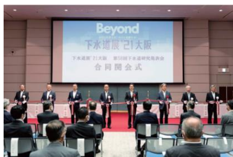
開会式（下水道展'21 大阪）