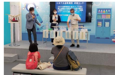
パブリックゾーン（下水道展'21 大阪）

パブリックゾーンでは、 小学生を中心とした一般来場者を対象 にしており、下水道の基本的な仕組みや役割、可能性について知ることができます。本年度は、開催地である東京都をはじめとして埼玉県・埼玉県下水道公社・所沢市、札幌市・北海道地方下水道協会、小平市、川崎市、相模原市が出展を予定し、各自治体がそれぞれ役割を分担して、下水道のしくみ等をわかりやすく紹介する予定です。また開催期間が夏休み中であることから、展示を見ながらクイズに回答していくことで、 夏休みの自由研究として活用できる「自由研究攻略ブック」 を配布します。