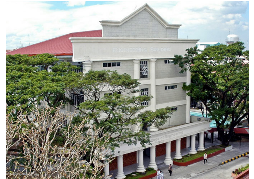
▲パーペチュアル・ヘルプ大学は フィリピンの中でも最もクオリティーの高い教 育機関の一つです