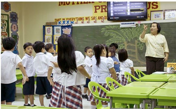
▲授業は全て英語で行われます。 お子さんが大学附属プリスクールで勉強中は、 親御様も大学で英語力アップ！

本親子留学プログラムは、はじめて「親子留学」にトライする方・ビギナー向けのプランです。幼少期・学童期前半 (4～7歳前後) のお子さまと、そのママをターゲットにし、世界第3位の英語国であるフィリピンの中でも最もクオリティーの高い教育機関の一つであるパーペチュアル・ヘルプ大学と共に、親子で英語力をアップ。急成長する新興国の中でも随一の英語国であるフィリピンのダイナミズムを感じることでできる高品質・低価格プランで、親子で世界で学ぶ機会を推進。きめ細やかな現地対応にてママが子どもと共に世界に羽ばたくチャレンジを応援します。