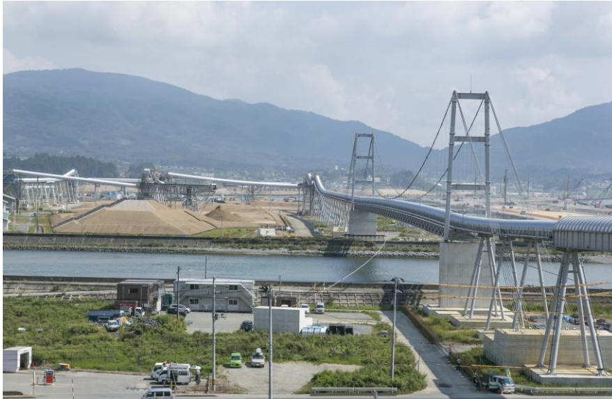
新たな街づくりのための土砂・岩を迅速に運搬しているのは、「希望のかけ橋」と呼ばれるベルトコンベヤー