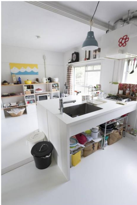
部屋全体を白に統一した「MUJI×UR」の住まい

誕生から60年。団地は多彩に進化し続けています。自然が豊かで日当たりがよい、団地ならではの環境の良さはそのままに、昔ながらの住まいを現代の暮らしに合うようリノベーションするさまざまな手法を工夫。民間企業とのコラボレーションにも積極的です。