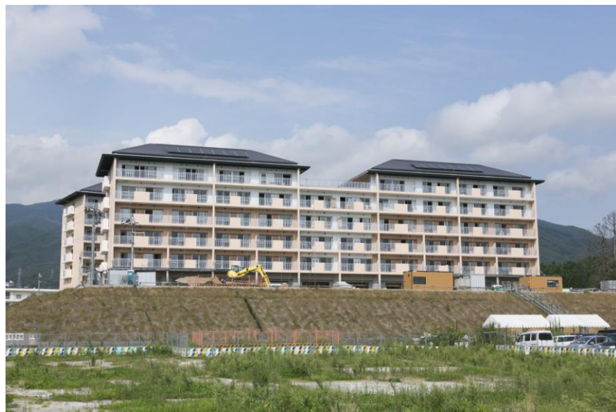
盛土の上に復興のシンボル災害公営住宅「下和野団地」が完成