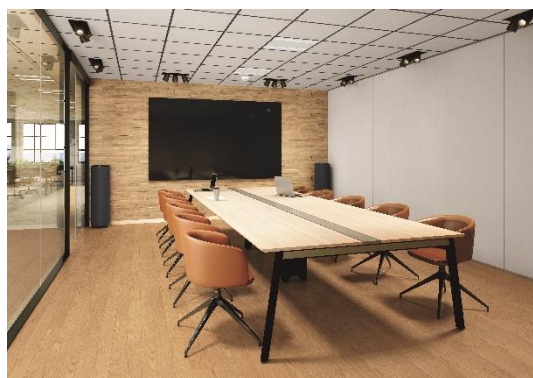
『コミュニケーションタフ バイオリーフ DW(オーク (クリア))』 施工イメージ

業界に先駆けて、公共・商業施設向けにバイオスマークを取得した製品を投入することにより、他社製品との差別化を図るとともに、自然環境へのさらなる負荷低減を推進してまいります。