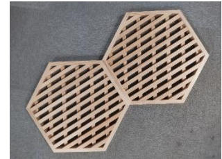
音響調整と意匠性を確保するため 木材(角材)の間隔と角度を変えて二段重ねしたパネル