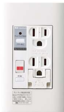
プレトラックコンセント

プレトラックコンセントは独自開発のプレトラック検出回路を搭載し、微小な放電電流を検知。回路を遮断し、アラームでお知らせします。怖いトラッキング現象を未然に防ぐことのできるコンセントです。