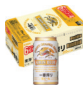
最多応募賞 10名にビール1年分(360本)