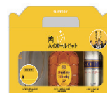
最多推薦賞 50名に角ハイボールセット