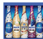
デザート賞 20名にカルピス 詰め合わせギフト