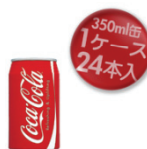
きっかけがすばらしいで賞 20名にコカ・コーラ1ケース