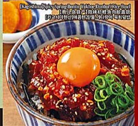
【Kagoshima】Spicy Spring Bonito Yukhoe Donburi Rice Bowl 【鹿児島産】激辛初鯉魚肉雑燗飯 【고고시미현산】매콤한알뜰탕이대량어회덮밥