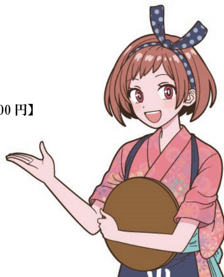
山内 さくら 山内農場公式キャラクター

ぜひ、この機会に当社店舗で、美味しい旬の料理をお楽しみください。 従業員一同、皆さまのご来店を心よりお待ちしております。