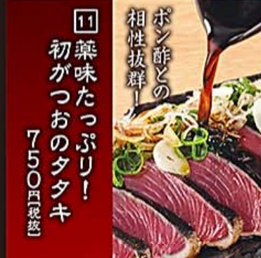
【Kagoshima】Lightly Seared Spring Bonito Loaded with Toppings 【鹿児島産】多量タタキ初鯉魚刺身 【고고시미현산】초제반 대용拼물 가다랑어회