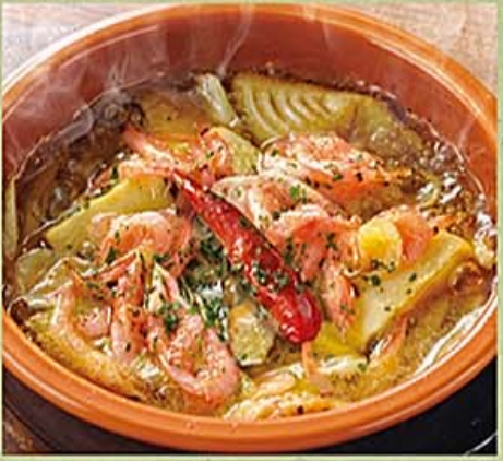
アヒージョ(2人前) 100円【税抜】

218 バケット(2個) 100円【税抜】 Baguette (2 pieces) 法式バケット(2個) 100円【税抜】