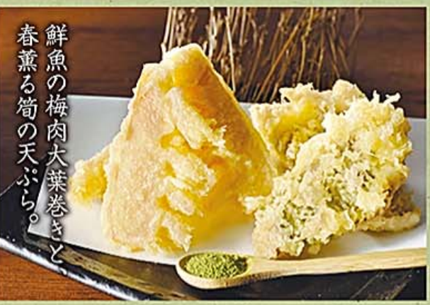
鮮魚の梅肉大葉巻きと 春薫る筍の天ぷら。

31 筍と鮮魚の天ぷら 〜知覧茶塩添え〜 580円【税抜】 Kyushu Bamboo Shoots & Fresh Fish Tempura 〜with Chikran Tea Salt〜 九州産筍と鮮魚大葉巻き、知覧茶塩添え ※全店共通のメニューです。全店舗で取り扱い。