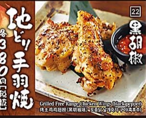
22 黒胡椒 Grilled Free Range Chicken Wings (black pepper) 焼土鶏鸡翅根(黒胡椒味) 토종닭날개즉지쿠이(흑후추)