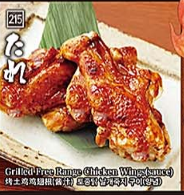
215 たれ Grilled Free Range Chicken Wings (sauce) 焼土鶏鸡翅根(酱汁) 토종닭날개즉지쿠이(양념)

21 筍と桜海老のアヒージョ 580円【税抜】 Ahi-Ji with Kyushu Bamboo Shoots & Sakura Shrimp 鹿児島産九州産筍と桜海老、アヒージョソースで煮る