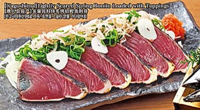
【Kagoshima】Lightly Seared Spring Bonito Loaded with Toppings 【鹿児島産】多量タタキ初鯉魚刺身 【고고시미현산】초제반 대용拼물 가다랑어회