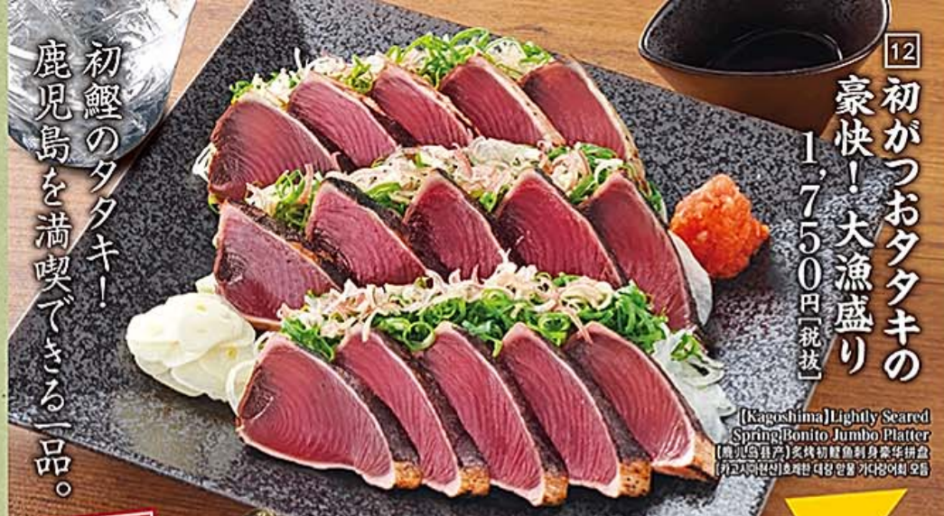
【Kagoshima】Lightly Seared Spring Bonito Jumbo Platter 【鹿児島産】豪快初鯉魚刺身豪華拼盘 【고고시미현산】초제반 대용拼물 가다랑어회 오름