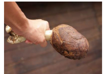
タイトル:あの日見た肉の味を、 僕らはまだ知らない

7月に発表された企画賞レースの行方も見逃すことができません。14賞総計240名に賞品がもらえるチャンスが新たに追加されましたが、特に最多応募賞レースは、賞品としてビール1年分(360本)が用意されており、ヒートアップの様相を示しています。現在の最多応募数は330品。これは毎日違うおかずを作り続けてもほぼ1年間分を賄える数字。これに続いてあと少しで300品に近づく応募者が数名いる状態で、最後まで見逃がすことができない展開となっています。