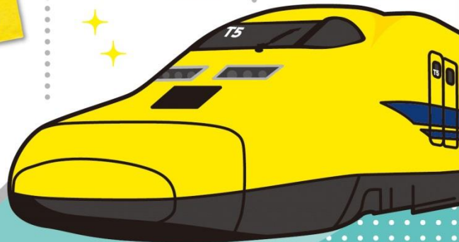
JR西日本商品化許諾済

※一部実施していない店舗がございます。※イトーヨーカドーでのお買物は対象外です。※1回のお買物・ご利用で応募券は最高10枚までとさせていただきます。※お預かりする個人情報は当キャンペーン以外には使用いたしません。