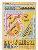
Dr.イエロー 定規セット

飲食・食品専門店で600円(税込)以上お買上げ、 またはご利用の小学生以下のお子様に先着プレゼント 全国88のショッピングセンターで実施