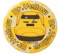
Dr.イエロー 缶バッジ

飲食・食品専門店で600円(税込)以上お買上げ、 またはご利用の小学生以下のお子様に先着プレゼント 全国88のショッピングセンターで実施