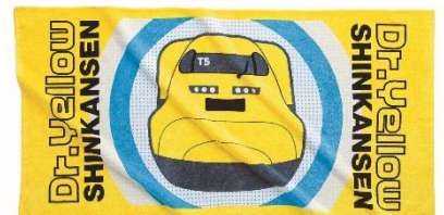
Dr.イエローデザインバスタオル