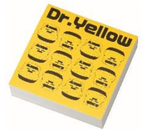
Dr.イエロー ブロックメモ

各専門店で1,000円(税込)以上お買上げのお客様に先着プレゼント 全国23のショッピングセンターで実施