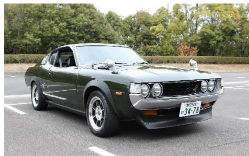
セリカリフトバック 2.0GT（1975年式/MT）

また、8月12日（土）から8月20日（日）までは、セリカXXと共に、セリカリフトバック 2.0GT（1975年式/MT）をホテルのメインエントランス前に展示いたします。ご宿泊されるお客様もそうでないお客様も、より多くの方々がこの2台の車両が持つ歴史と魅力を間近で感じることができる機会となります。