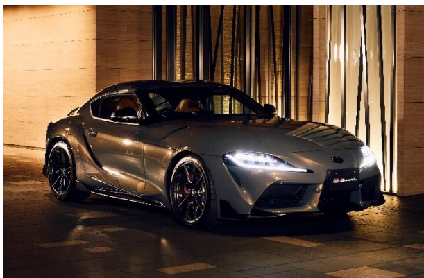
GR スープラ (2022 年式/MT)