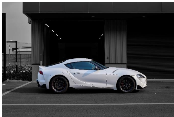
GR スープラ (MT)