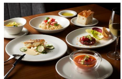
イタリアンディナーコース