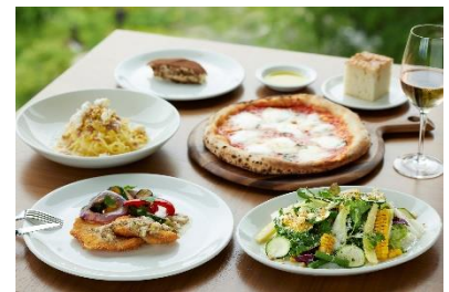
イタリアンランチコース

ディナーコースでは、それぞれ3種類から選べるパスタとメイン料理を含む5品が提供されます。一押しのお魚のソテーは、温かい蕪と生ハムのサラダに、レモン風味のバターソースの濃厚な旨味が感じられる逸品です。色彩鮮やかで目にも楽しいイタリアン料理を心ゆくまでお楽しみください。