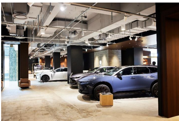
▲THE CROWN 福岡天神展示の様子

『CROWN STYLE CARAVAN in THE CROWN』は、“あなたにとってのクラウンに出会う旅”をテーマとして、2024年秋以降に発売予定の新型クラウン（エステート）を含めた4つのモデル展示とともに、“知る”・“触れる”・“走る”といった様々な体験を通して、新型クラウンの魅力を存分に味わっていただく場をお届けしたいという想いで開催しました。