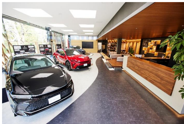
▲THE CROWN 横浜都筑展示の様子