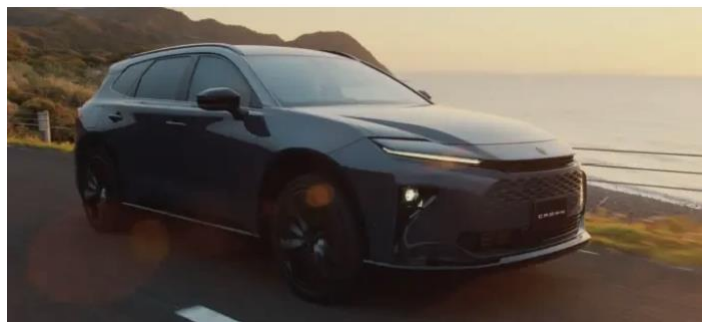
※【左】クラウン特別仕様車 CROSSOVER RS “LANDSCAPE”／【右】クラウン（エステート）

クラウンは初代から脈々と受け継がれてきた「革新と挑戦」のDNAのもと、お客様一人ひとりの価値観や多様なライフスタイルにお応えする4つのモデルだけではなく、これからも時代の変化に合わせた最良の選択肢としてクラウンのあるライフスタイルの可能性を広げてまいります。