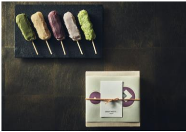
日比谷 五街道団子5種（箱入り） 1,500円