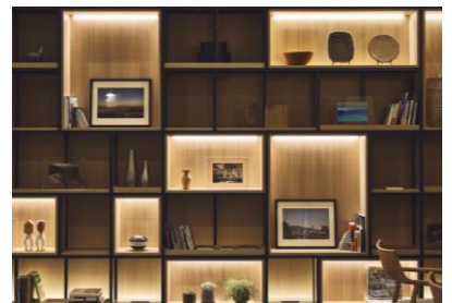
各地域の多様な風土、 手しごとをテーマに日本全国を 9地域に分けたディスプレイ