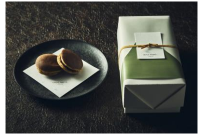
どらやき 5個セット（箱入り） 1,700円