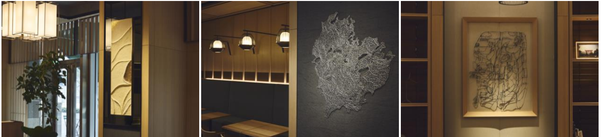
日本の美意識を現代の感覚で極めようとする作家たちによる「道」をモチーフにしたアート作品