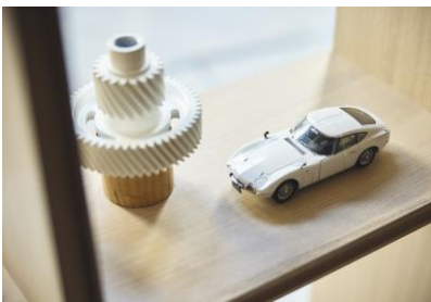
全国各地域で生産されている車両パーツを使用したオブジェ