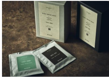
小林可夢偉さん監修コーヒー DRIP BAG 5個セット（箱入り）1,720円 COLD BREW 5個セット（箱入り）1,720円