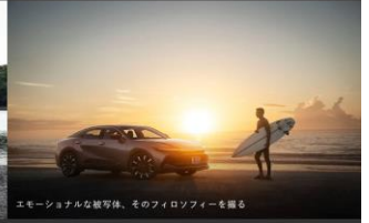
エモーショナルな被写体、そのフィロソフィーを撮る