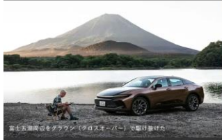
富士五湖周辺をドライブする Crown (クロスオーバー) の魅力を撮った