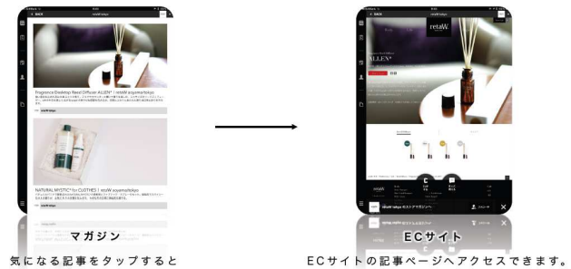
気になる記事をタップすると