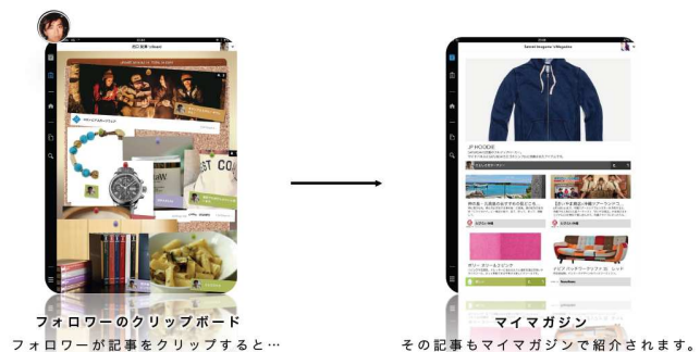
フォローのクリップボード