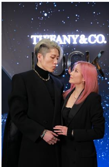
MIYAVI & Melody