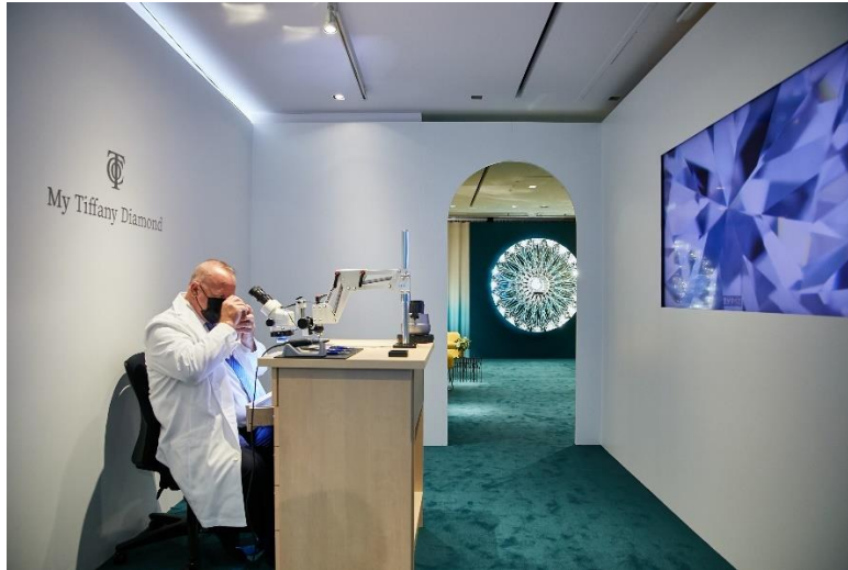
ティファニーニューヨーク本店より来日したダイヤモンドセッター

“MY TIFFANY DIAMOND”(マイ ティファニー ダイヤモンド)と題されたこのスペシャルなプログラムは、ダイヤモンドオーソリティとしてティファニーが誇る最高品質のダイヤモンドをルースストーンから直接お選び頂き、お好きなリングデザインと共に特別にセッティングをいたします。そしてこの期間中、特別にティファニー ニューヨーク本店よりダイヤモンドセッターが来日いたします。会場では、ティファニーが誇るクラフトマンシップを象徴する卓越した技術を間近でご覧いただけます。