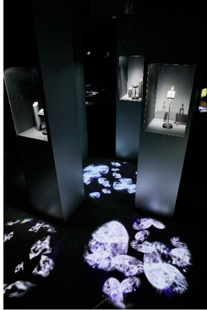
ティファニーが誇る ダイヤモンドジュエリーの数々

1886年にチャールズ・ルイス・ティファニーによって生み出されて以来130年以上にわたり、世界中の素晴らしいラブストーリーのシンボルとして輝き続けている6本爪のアイコン的な「ティファニー®セッティング」をはじめとするティファニーのエンゲージメントリングたち。会場には、ダイヤモンドオーソリティであるティファニーが誇る数々のダイヤモンドジュエリーをご覧いただけるお部屋も。ダイヤモンドの調達・製作プロセスにおける透明性を掲げるティファニーのダイヤモンドジュエリーの美しい輝きをご堪能頂けます。