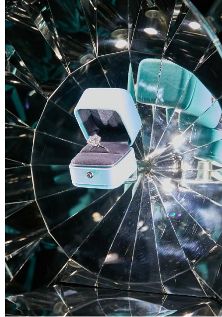
アイコン的な「ティファニー®セッティング」 エンゲージメントリング

期間中リングをご購入頂いたお客様には、50周年限定デザインのショッピングバッグにてお渡しいたします。尚、7月15日(金)、16日(土)の2日間は予約なしにて全てのお客様が、7月17日(日)から8月14日(日)まではお電話にてご予約頂いたお客様がご来場いただけます。