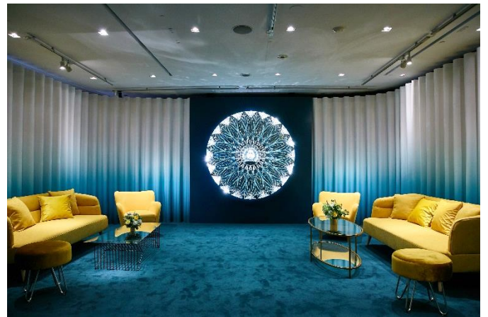
ダイヤモンドから着想を得たデコール