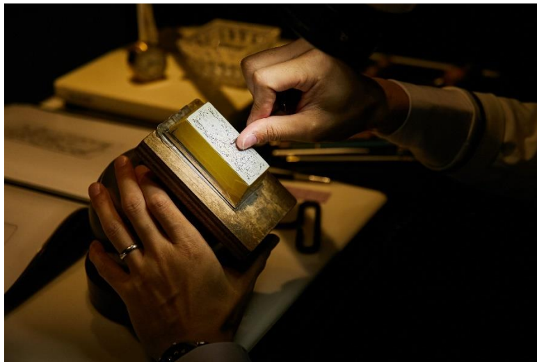
ティファニーが誇るエングレーピングサービス

また、ティファニーのエンゲージメント リングやウエディング バンドリングをさらに特別なものとするエングレーピングサービスもご用意しております。特別なメッセージやシンボル、イニシャルなどを刻印することによって世界でひとつだけのリングにカスタマイズできるサービスを体験いただけます。