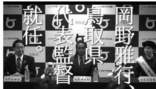
観光PR動画内、記者会見の様子

http://www.pref.tottori.lg.jp/tottoridouchannel/