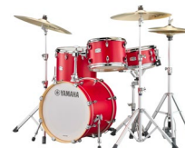
ヤマハ アコースティックドラム 「Tour Custom」