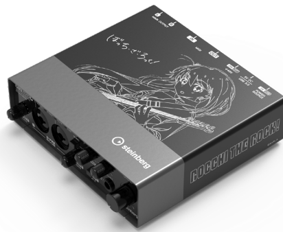
スタインバーグ USB オーディオインターフェース 『UR22C Bocchi Edition』

株式会社ヤマハミュージックジャパンは、『劇場総集編ぼっち・ざ・ろっく!』（劇場上映：前編 2024年6月7日、後編 2024年8月9日）とコラボレーションした、Steinberg Media Technologies GmbH（ドイツ ハンブルク、以下、スタインバーグ社）のUSB オーディオインターフェース『UR22C Bocchi Edition』を、7月1日（月）から28日（日）まで期間限定で受注販売します。本モデルには、今回のコラボレーションのために描き下ろされた主人公などのイラストをデザインしています。