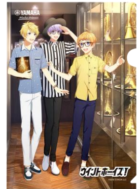
オリジナルクリアファイル