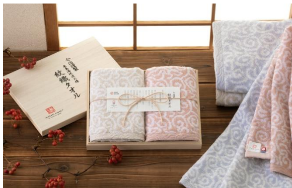
写真:フェイスタオル2枚セット 箱サイズ:22×28×5cm 価格:2,000円(税抜)

シリーズの商品ラインナップは全10種類(1,000円～10,000円) * 全て木箱入り