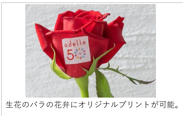
生花のバラの花弁にオリジナルプリントが可能。