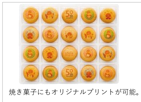
焼き菓子にもオリジナルプリントが可能。