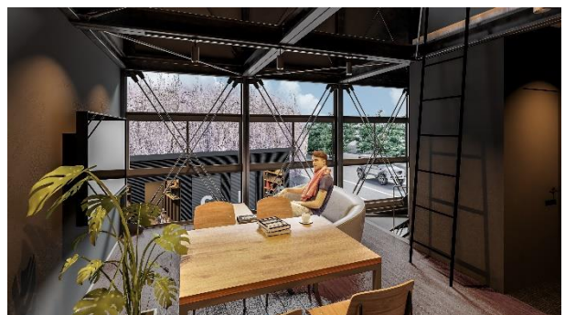
【2階 居住スペース（イメージ）】