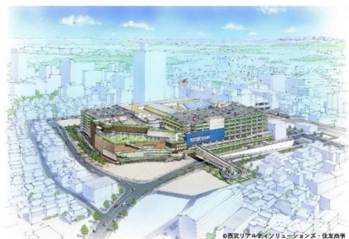
所沢駅西口開発計画 鳥瞰イメージ