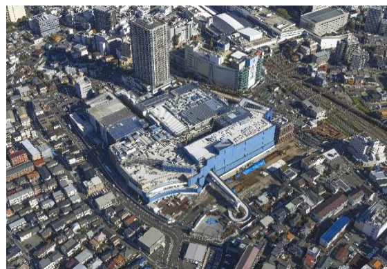
航空写真（2023年11月22日撮影）