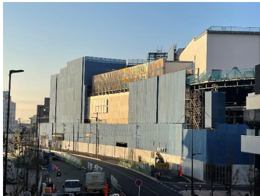
所沢駅西口開発計画（2023年11月27日撮影）