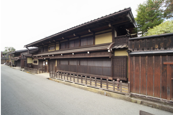
日下部民芸館外観

谷屋を営む日下部家は江戸時代から同地で暮らしを営んでおり、祭り屋台に代表される飛騨の豊かな町民文化と経済を牽引してきた「旦那衆」と呼ばれた旧家の一つです。明治以降の町家建築としては初めて国指定重要文化財に指定されたその住まい「日下部家住宅」の一部を改装して「日下部民芸館」として一般公開しています。