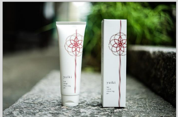
ブランド第一弾アイテム 『yuiki hot scrub cleansing gel (ユイキ ホットスクラブクレンジングジェル)』(メイク落とし)