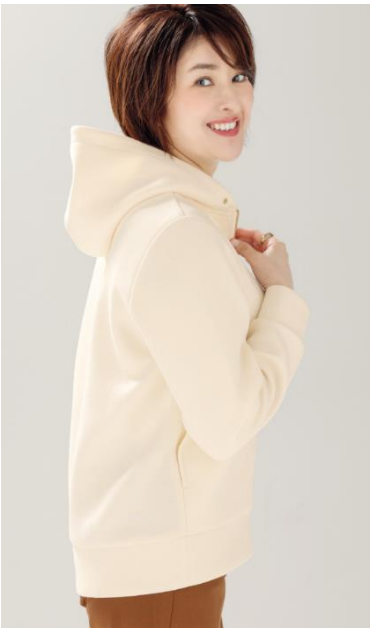
前後差のある丈でお腹やヒップをカバー。

大人の柔らかいボディでも着ぶくれせずすっきり美しく見せることを追求。シルエットにふくらみが出ないようにサイドポケットの内生地を工夫したり、脇の縫い目を前側に設計してほっそりしたシルエットに演出するなど、細部までこだわりが詰まっています。