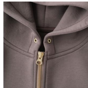
フードの襟もとにはゴールドのハトメをつけておしゃれのアクセントに。