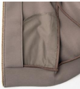
サイドポケットの裏地は薄手の生地で作ってふくらまない設計に。

また、お腹まわりやヒップなどの肉付きが気になる部分は前後差のある丈がさりげなくカバーし、すっきり演出します。