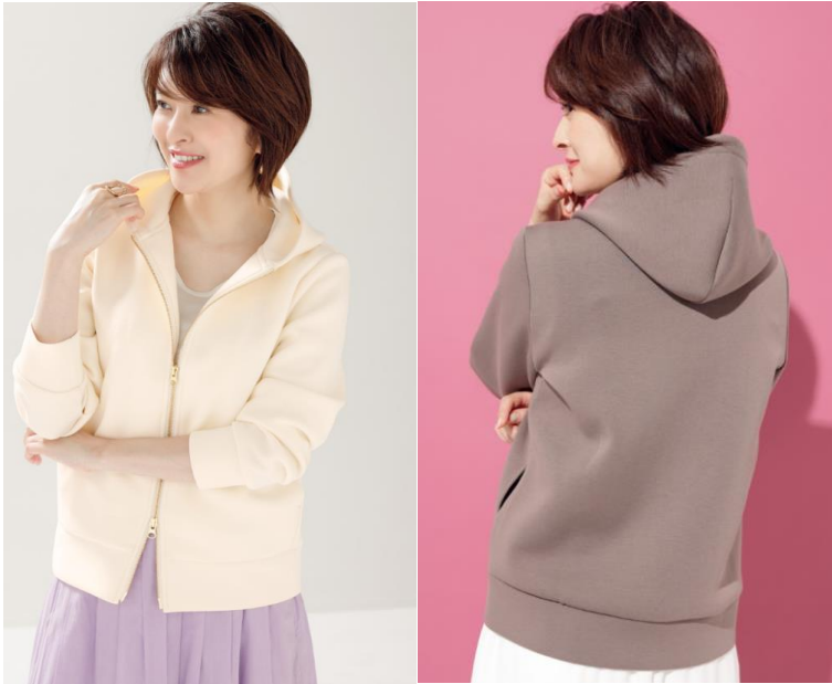
襟もとからふっくらと立ち上がるフード。 後ろから見てもフードが潰れずに美しい。

大人世代が気になる首からデコルテまわりの寂しさを、ふっくら立体的なフードが華やかに演出してくれることに着目。一般的にフードのふっくら感を実現しやすいのは被るタイプのパーカーですが、大人女性にはカジュアル度が高く着こなしが難しいアイテム。