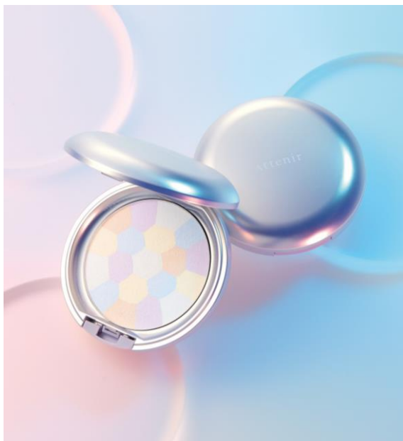
『フロストベールパウダー』 SPF30・PA+++ 限定アイテム/全1色 価格2,970円(税込)/2,700円(税抜)

5色の計算されたパウダーで、くすみを飛ばし涼やかな印象に仕上げる「フロストベールパウダー」。汗や皮脂によるくずれを防いで、涼やかな美肌を一日中キープ。スキンケア成分も配合し、長時間のマスク着用による肌荒れを抑えます。そして光を集めて涼しげに輝き、大人の目もとを美しく見せるリキッド状アイカラー「アクアプリズムアイカラー」。大きさの異なる多色パールが涼やかなきらめきが、くすみがちな目もとを明るく仕上げ、つやめく印象的な仕上がりに。大人ならではの悩みを解消しながら、夏顔を爽やかに彩ります。