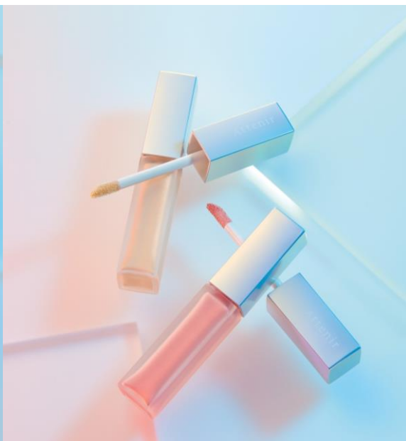
『アクアプリズムアイカラー』 <シャンパンソルベ><オレンジソルベ>限定アイテム/全2色 価格1,540円(税込)/1,400円(税抜)