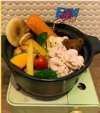
季節のスープカレーの湯