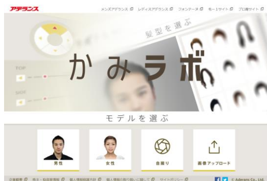
「かみラボ」 （男女兼用）

「ヘア TRY」ではパソコンからの利用に限られていたのが、「かみラボ」と「おためしヘア」ではスマートフォンとタブレットでも利用できるようになりました。パソコン用カメラやスマートデバイスで自撮りをして、すぐに仮想体験いただけます。また、完成した画像は、保存することができます。