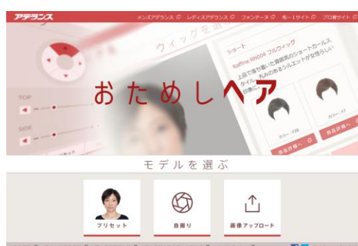
「おためしヘア」 （女性用）