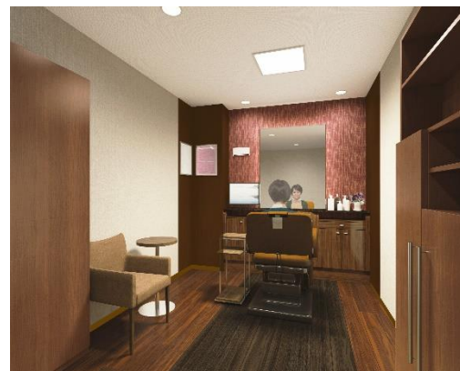
「アデランス松本」女性用ブース