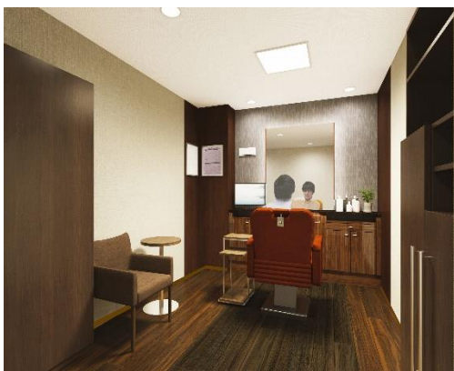
「アデランス松本」男性用ブース

店内には、周囲を気にせずリラックスしてご利用いただける個室のブースを男性用4室、女性用3室をご用意し、プライバシーにも配慮した作りになっています。カウンセリングルームには、頭皮の状態をチェックし、お客様にご覧いただきやすいよう大型モニターを設置しました。