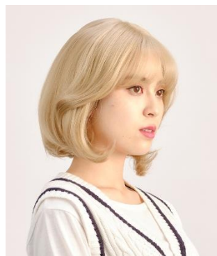
エギョモリアレンジ