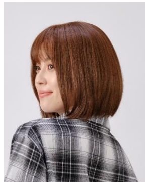
タッセルカットアレンジ