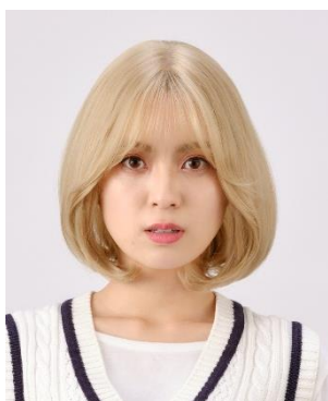
前髪カットスタイル

NAVANA ウィッグは耐熱素材（160℃まで）を使用しているため、ストレートアイロンやコテでアレンジをすることが可能です。アレンジ次第で、タンバルモリ※ 1 やエギョモリ※ 2 といった様々なスタイルを表現できます。また、ウィッグは店舗でカットすることができるため、前髪を作り雰囲気を変えることも可能です。