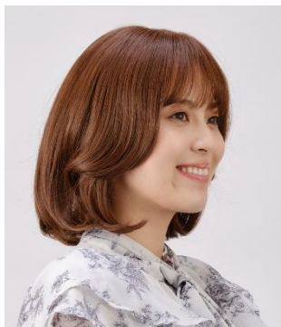
サイドバングカール

韓国ヘアは顔周りのカットが最も特徴的です。サイドバングをワンカールし毛先をフェイスラインに流すことで、抜け感のある華やかなスタイルに仕上がります。程よいタッセルカットにすれば、毛先にボリュームが残り、裾広がりに見えるため柔らかくふんわりとした印象になります。