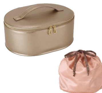
お役立ちバニティバッグ (小物整理に使える巾着付き)