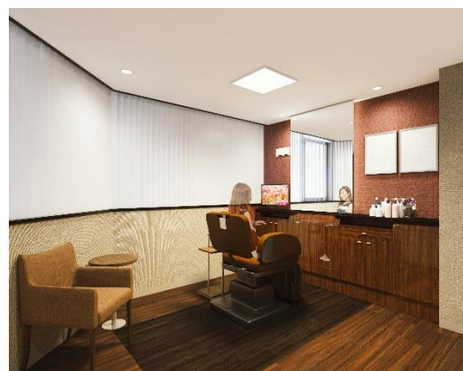
「アデランス岡崎」女性用ブース