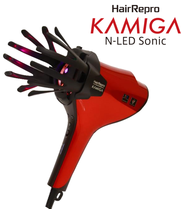
HairRepro KAMIGA N-LED Sonic

本商品は、2つの吹出口から髪の広範囲に風を届ける速乾方式や、熱ダメージや過乾燥を抑える温度に自動調節する「センシングドライモード」などのシャープ独自技術に加え、LED光源「N-LED beam®」（エヌ エルイーディー ビーム）と、付け替え可能な当社オリジナルのかつさアタッチメント「カミガハンド」「カミガかつさ」を搭載したドライヤーです。髪を乾かす機能に加え、ご自宅でスカルプエステが楽しめる「KAMIGAモード」が搭載されている点が最大の特徴です。また、速乾方式の採用により、当社従来機（N-LED Sonic）と比べ、ドライ時間を約50%短縮※2。さらに、プラズマクラスターイオン※3により静電気を約96%低減※4します。「かつさアタッチメント」で髪をかき分けながら、プラズマクラスターイオンと「N-LED beam®」の赤色LEDと青色LEDを、髪と頭皮にたっぷり届けます。