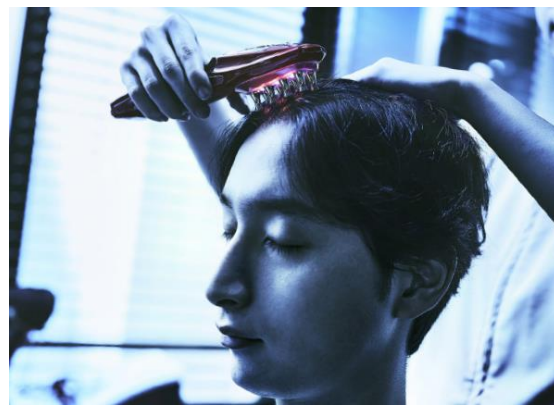
「HairRepro」「Scalp Up」育毛コース メニューイメージ