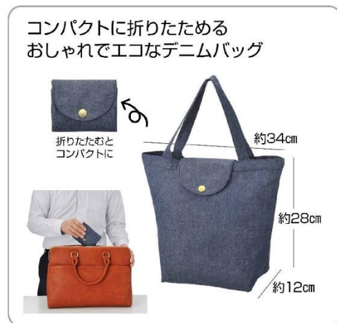
デニム折りたたみバック