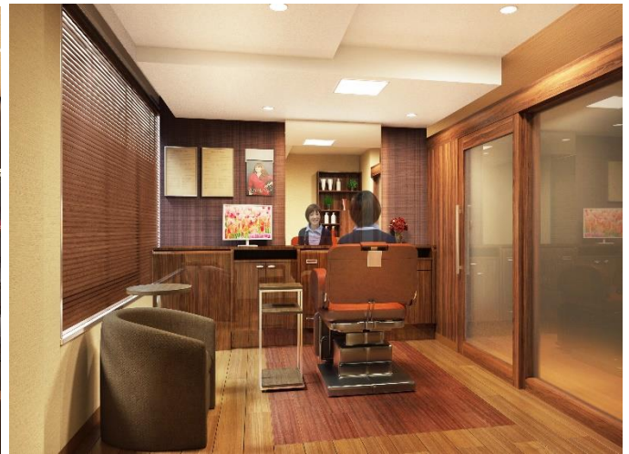
左：エントランス、右：女性ブース（イメージ図）