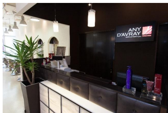
『アニーダブレイ福岡けやき通り』