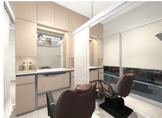
プライバシーに配慮した施術ブース(イメージ図)