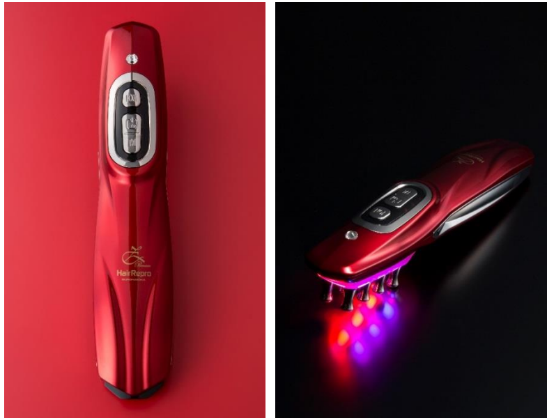
HairRepro Z Premium