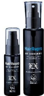
左:GF エッセンス G 右:GF エッセンス S