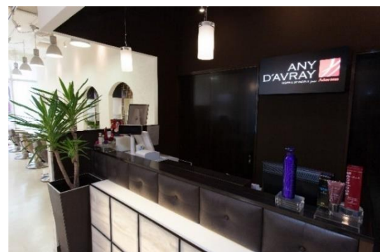
『アニーダブレイ福岡けやき通り』