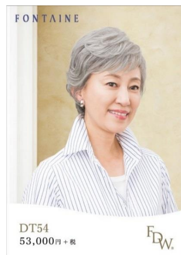
グレイヘアのトップピース (DT54)

新発売するグレイヘアウィッグは、頭全体を覆うタイプの「フルウィッグ」と頭頂部に装着するタイプの「トップピース（部分ウィッグ）」の2タイプです。