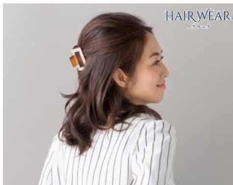
「HAIR WEAR®」 パーツウィッグ

「HAIR WEAR®」は、髪の悩みが変わり始める40代～50代の大人女性に向けて、「ファッション感覚で『手軽』にヘアアレンジを楽しむ」をコンセプトに、髪の悩みをオシャレに解決するウィッグを提供します。後頭部をふんわりボリュームアップさせる「パーツウィッグ」(4,800円/税別)と、前髪が作れて白髪もカバーできる「バングウィッグ」(18,000円/税別)の2商品で展開します。