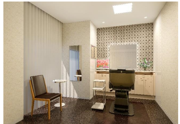
女性用ブース（イメージ図）