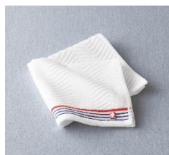
ステンレストンブラー（左）、 今治 あやなみハンドタオル（右） （男性向け）