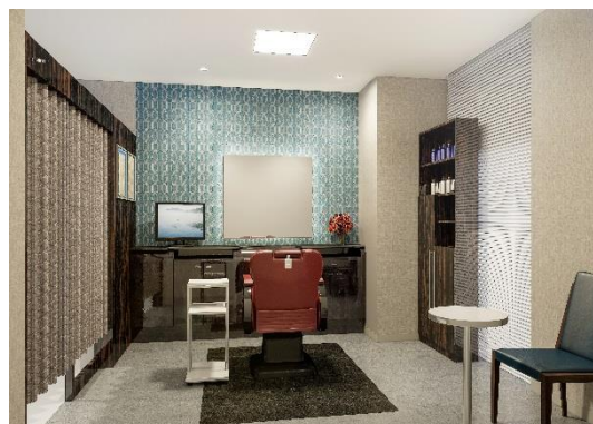
男性用ブース（イメージ図）