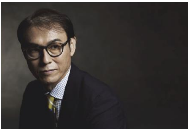
左：「ヘアパーフェクト ワールド™」使用前

また、見た目の自然さを実現する毛植え技術として、フロント部に特殊技術で髪の毛の根元を肌色に染めた毛材を採用することで額の皮膚と同質化させる「インビジブル毛植®」、微細なネットの編み目から植えた毛を引き抜くことで、毛植えの結び目を直接見えなくする「スカルプスルー毛植®」を施しており、リアルとナチュラルを極限まで追及しました。