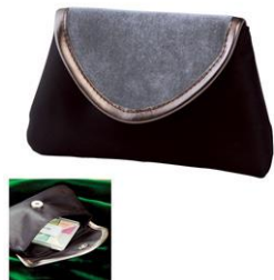
クラッチポーチ（女性向け）