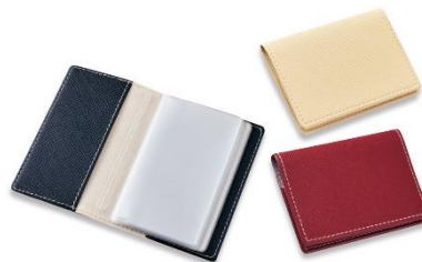
カードケース（男性向け）